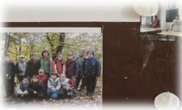
8.B – třpytivé odlesky