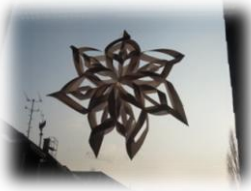
7. A - různé podoby origami