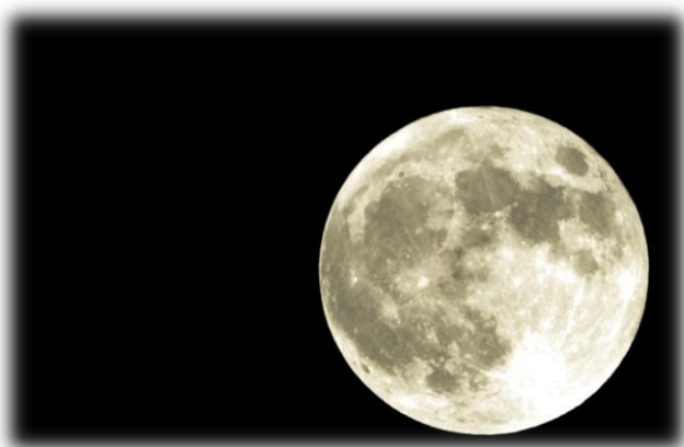
Petr Ochonský (6. B) Měsíc