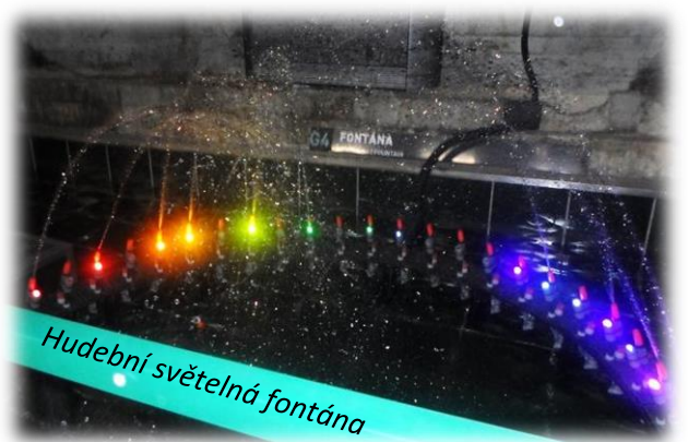
Hudební světelná fontána