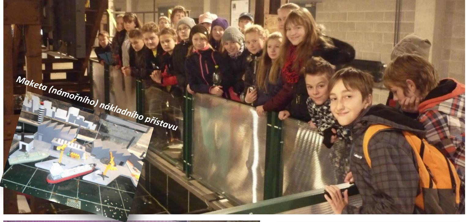
Maketa (námořního) nákladního přístavu